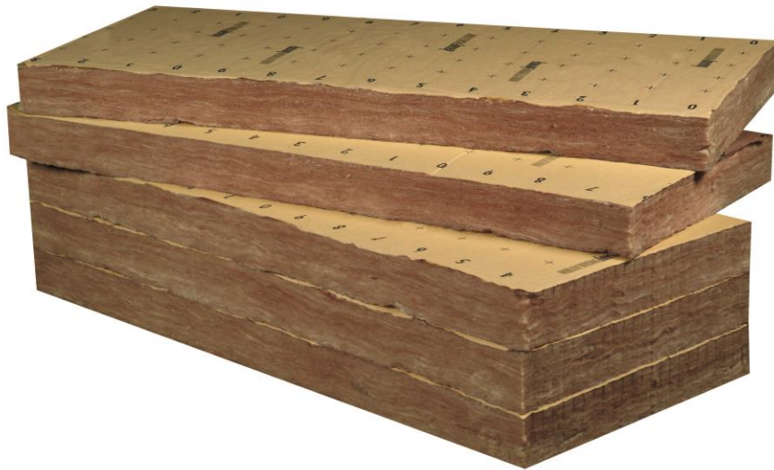
Knauf Insulation laine de verre ECOSE® TP 238 85 mm